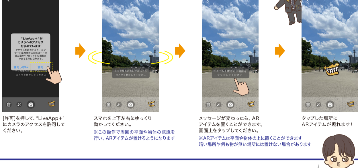
[許可]を押して、“LiveApp+”にカメラのアクセスを許可してください。 スマホを上下左右にゆっくり動かしてください。 ※この操作で周囲の平面や物体の認識を行い、ARアイテムを置くようになります メッセージが変わったら、ARアイテムを置くことができます。画面上をタップしてください。 ※ARアイテムは平面や物体の上に置くことができます。暗い場所や何も物が無い場所には置けない場合があります タップした場所にARアイテムが現れます!