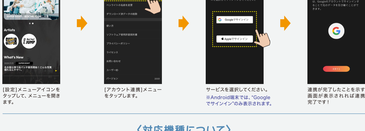
設定メニューアイコンをタップして、メニューを開きます。 [アカウント連携]メニューをタップします。 ※Android端末では、“Google”でサインインのみ表示されます。 連携が表示されたことを示す画面が表示されたら連携完了です!

アプリのアンインストールや、スマホの機種変更をすると、BOYが使えなくなってしまいます。アカウント連携をしておくことで、アンインストール後の再インストールや、スマホの機種変更後に、BOYを継続して使えるようになります。