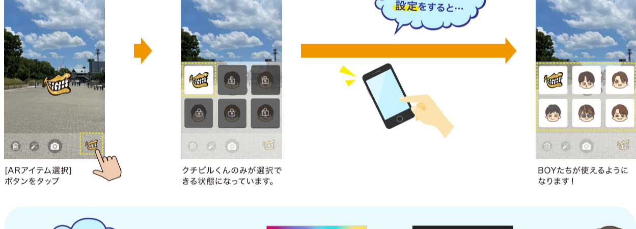
[ARアイテム選択]ボタンをタップ クチビルくんのみが選択できる状態になっています。 BOYたちが使えるようになります!

“Always togetherR”では、缶バッジを購入していない状態でも、クチビルくんを使ってARフォトを楽しんでいただけます。缶バッジを購入して二次元コードを読み込むと、購入したメンバーのBOYが使えるようになります!