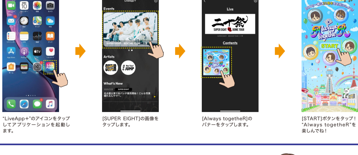
“LiveApp+”のアイコンをタップしてアプリケーションを起動します。 [SUPER EIGHT]の画像をタップします。 [Always togetherR]のパナーをタップします。 [START]ボタンをタップ!“Always togetherR”を楽しんでね!