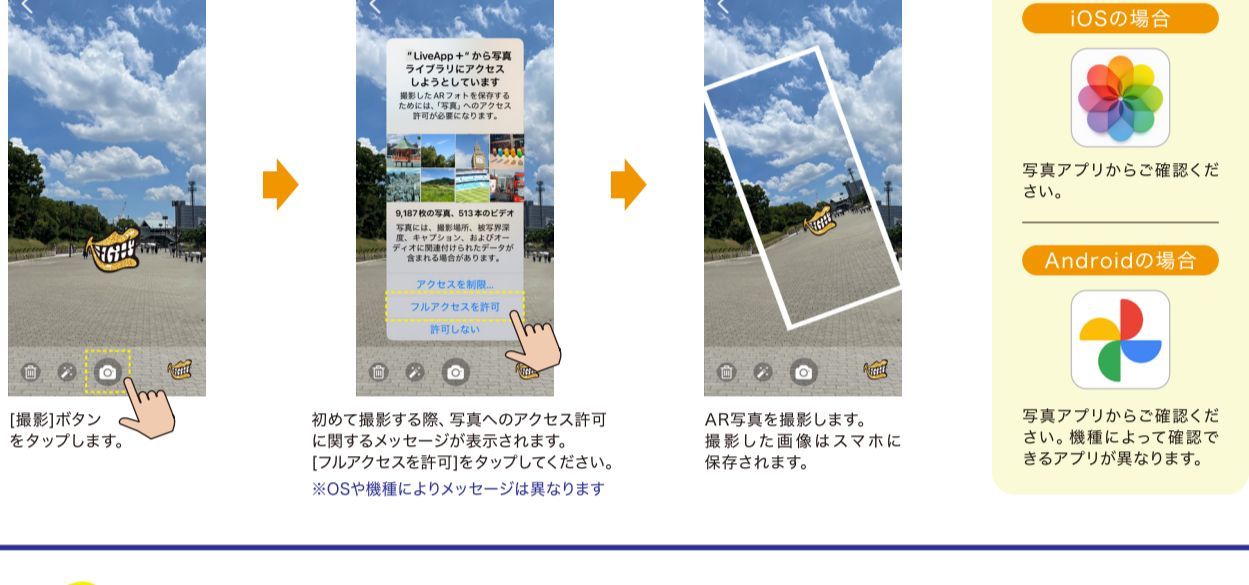
[撮影]ボタンをタップします。 初めて撮影する際、写真へのアクセス許可に関するメッセージが表示されます。[フルアクセスを許可]をタップしてください。 ※OSや機種によりメッセージは異なります AR写真を撮影します。撮影した画像はスマホに保存されます。